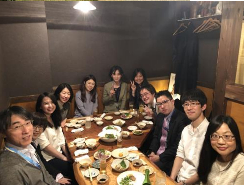
懇親会 鰹が美味しい！