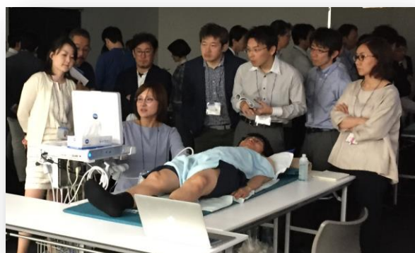
ハンズオンの講師を務めました